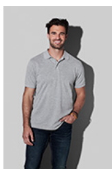
ST9060 C Harper Polo